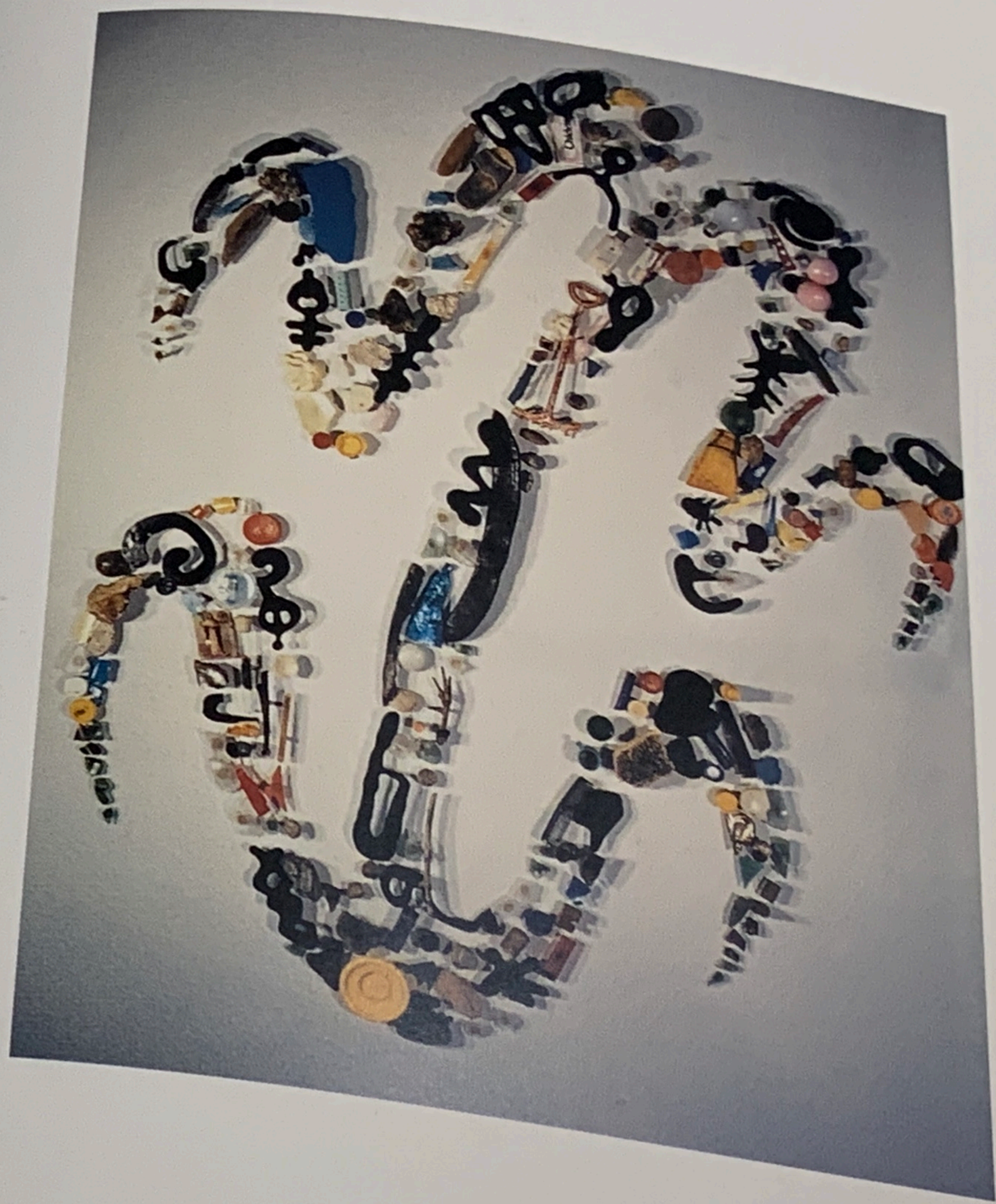
Sin título | Untitled | Ohne Titel. 1999 Técnica mixta | Mixed media | Mischtechnik, 228,6 x 139,7 cm.