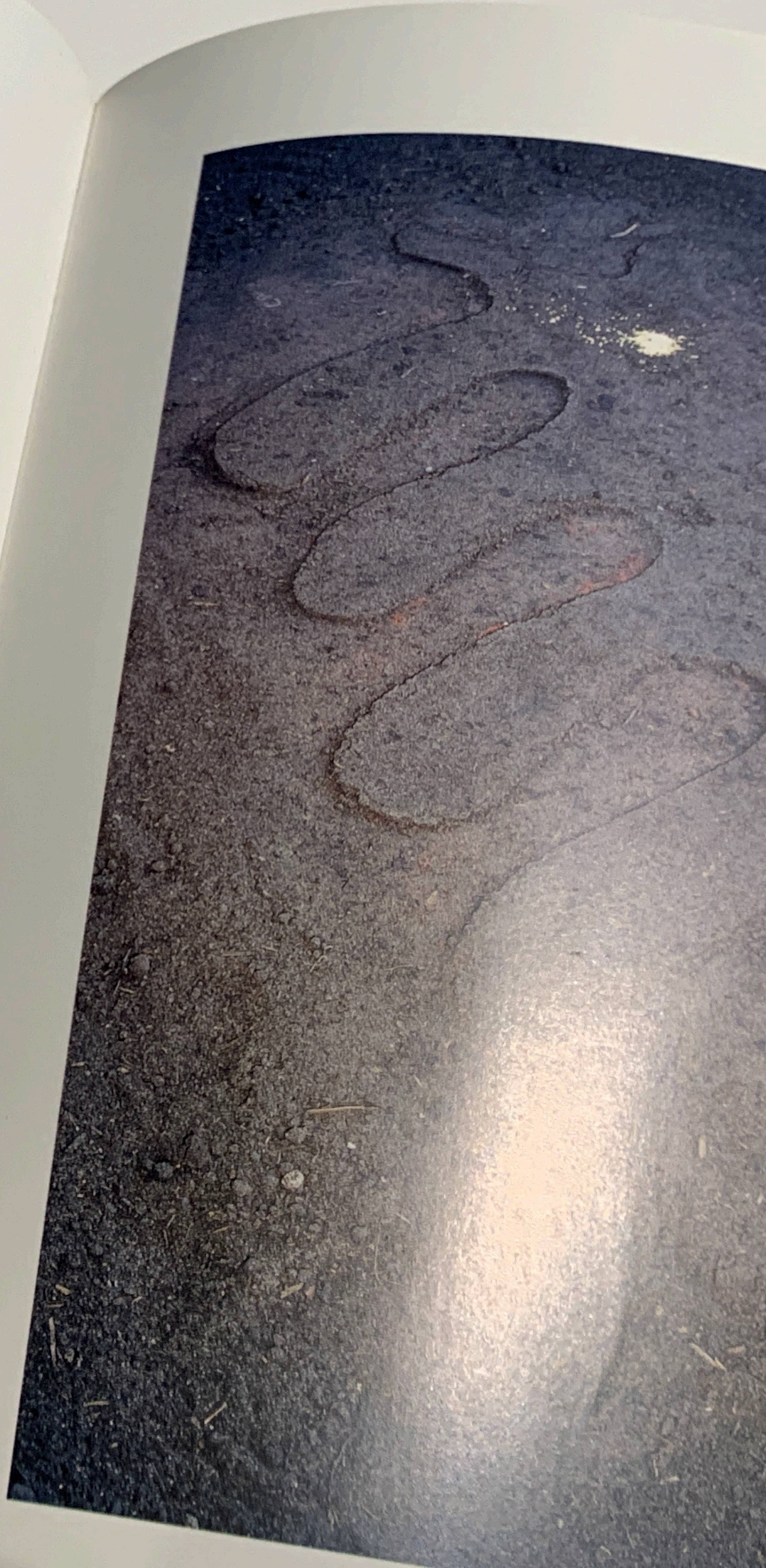
Futter für die Vögel