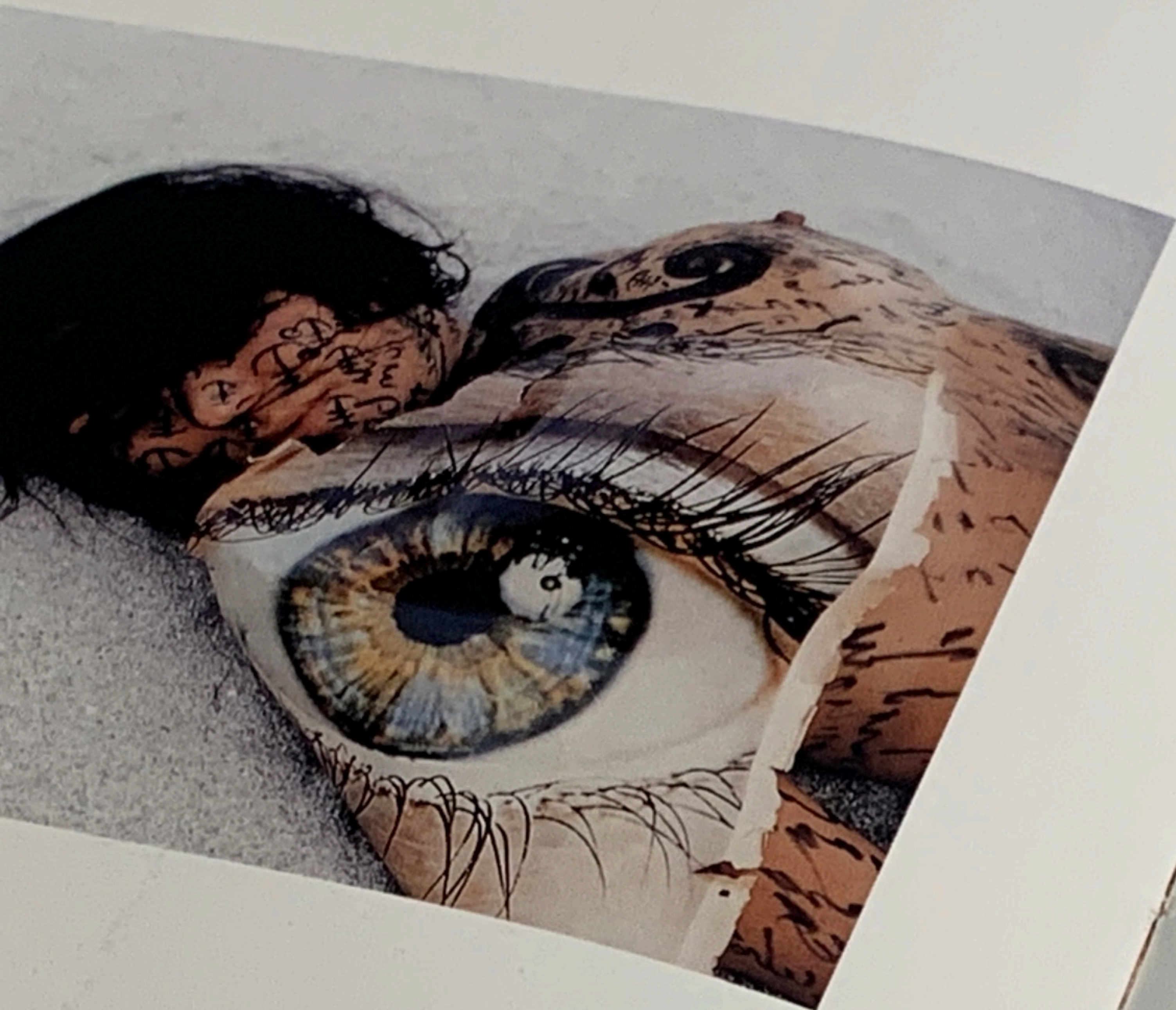
The Vague Year, 2001 C-print. 89,54 x 152,4 cm.